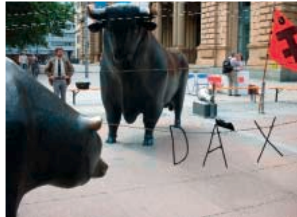
Protestaktionen vor der Frankfurter Börse.

Bezug von Sozialhilfe in vielen Fällen nicht ausreichend, um frei von Armut leben zu können. Die Niveauabsenkung der Sozialhilfe würde dieses armutspolitische Problem noch verschärfen. Eine weitere Absenkung der Sozialhilfe darf es daher nicht geben.