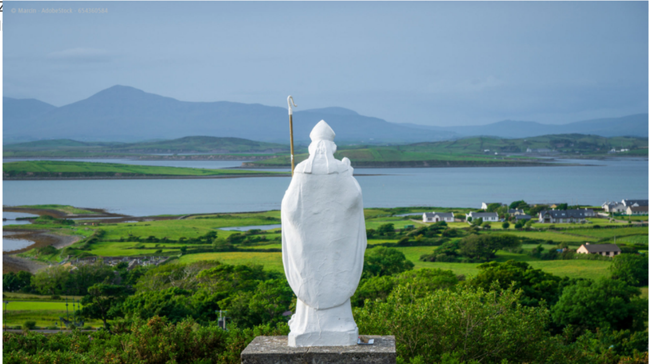
Statue des Heiligen Patrick am Anfang des Fußweges zum Gipfel des Croagh Patrick, County Mayo, Irland