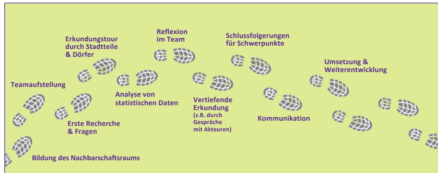
Abb. 3: Möglicher Ablauf einer Sozialraumerkundung

wählter Daten der kommunalen Entwicklung (quantitative Methoden). Um diese Erkundungen und Analysen gut zu gestalten, können Kirchengemeinden fachliche Unterstützung nutzen (mehr dazu in Kapitel 3.1 und Anhang B).