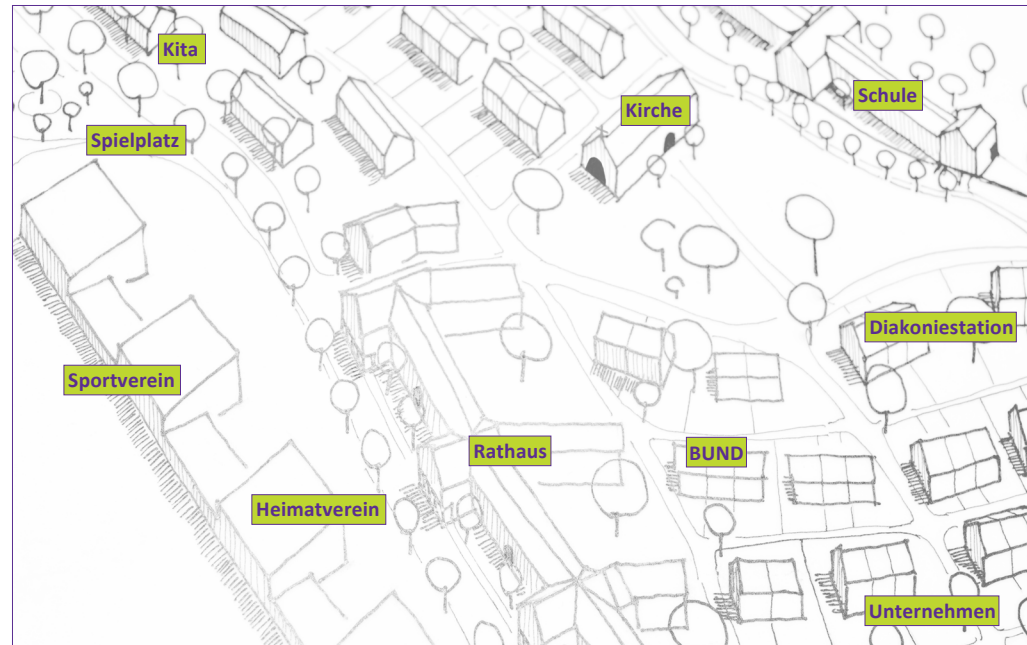
Abb. 2: Kirche im Sozialraum

Die Zusammenarbeit mit anderen Akteur*innen im Dorf oder Stadtteil hilft, das Knowhow und die Kräfte zu bündeln und mit Ressourcen effektiv umzugehen. So können zum Beispiel: