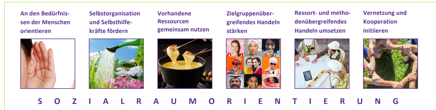
Abb. 1: Handlungsprinzipien der Sozialraumorientierung